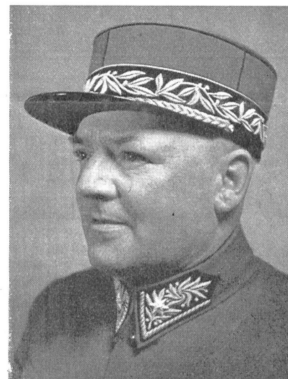
Der Bundesrat ernannte an Stelle des zurückgetretenen bisherigen Waffenchefs der Genietruppen