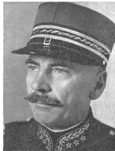
Der Bundesrat hat den Rücktritt des Oberkriegskommissärs

zum neuen Oberkriegskommissär der Armee ernannt. (Zensur-Nr. VI G 9308 Photopref.)