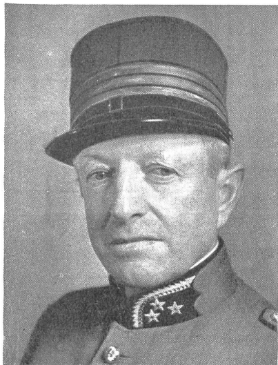
Als Nachfolger des zum Waffenchef der Genie beförderten Oberstdivisionärs F. Gubler hat der Bundesrat