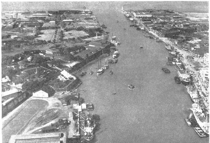
Der Handelshafen von Manila. — Le port commercial de Manille. Il porto commerciale di Manila.

Viele von ihnen sympathisieren auch stark mit den Japanern, während merkwürdigerweise andere um so größeren Haß gegen die »Preußen des Ostens« entwickeln. Diese Bevölkerungsteile sind auch sonst sehr klug und gebildet, stellen zahlreiche Künstler, die man in Europa, irrgeliebt durch die spanisch-klingenden Namen, für Spanier hielt. Letztere selbst bilden eine Minderheit, sie sind meist ehemalige Beamte, Soldaten, Angehörige des Klerus, die Einheimische geheiratet und sich dauernd hier niedergelassen haben. Die Chinesen dürften etwa 3 % der Gesamtbevölkerung ausmachen. Sie stellen die billigen Arbeitskräfte, freilich haben sich auch viele von ihnen eingeborene Frauen genommen oder entstammen solchen Ehen und unterscheiden sich deshalb nur wenig von den wirklichen Philippinos, zahlreiche von ihnen sind Aerzte, Advokaten, Apotheker, Priester und Beamte geworden.