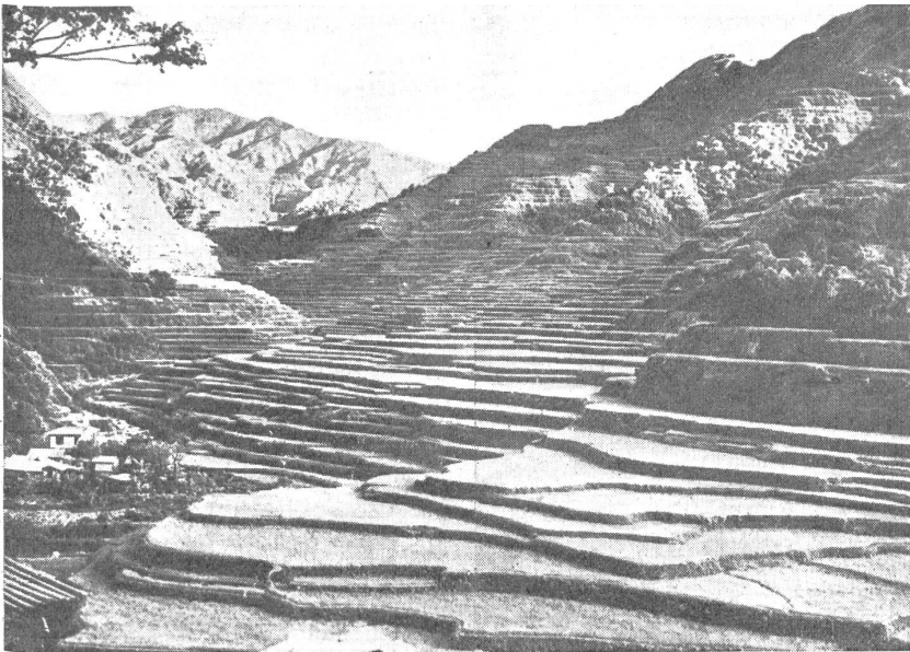
Reisterrassen in den Bergen von Nordluzon. — Rizières en terrasses dans les montagnes au nord de Luçon. — Coltivazioni di riso a terrazze nelle montagne settentrionali dell'isola di Luzon.

Lotterwirtschaft um sich und öffnete der Ausbeutung der einheimischen Bevölkerung Tür und Tor.