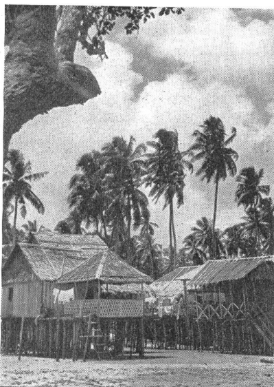
Eingeborenendorf auf den Philippinen. Village indigène dans les Philippines. Villaggio di indigeni nelle Filippine.

Verläßt man im Hafen das Schiff, so gewahrt man, daß sich hinter den Geschäftshäusern das Wahrzeichen der Stadt, die alten Befestigungen, erheben, es sind die Intramuros, die die Altstadt umgeben. Durch die Straßen eilen die Rikschas und überall gewahrt man barocke katholische Kirchen, die aussehen wie die spanischen Kathedralen, auch von Spaniens Kunst und Kultur Zeugnis ablegen. Manila ist die Hauptstadt, von hier aus wird das gesamte Territorium, das etwa achtmal so groß ist wie die Schweiz, und von zirka 16,5 Millionen Menschen besiedelt ist, regiert. Der Archipel ist natürlich eine wertvolle militärische Position der angelsächsischen Mächte hier im Osten und auf dem vulkanischen Boden gedeiht eine üppige Landwirtschaft, die für die Selbstversorgung der Inselgruppe genügen dürfte, so daß sich diese auch im Falle einer Blockade längere Zeit halten können. Flottenstützpunkte und Flugplätze sind auf allen größeren Inseln zu finden. Die Amerikaner hatten hier in Friedenszeiten 25,000 Mann stationiert, etwa 200 Flug-