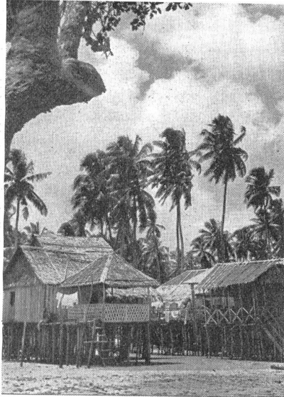
Eingeborenendorf auf den Philippinen. Village indigène dans les Philippines. Villaggio di indigeni nelle Filippine.

Verläßt man im Hafen das Schiff, so gewahrt man, daß sich hinter den Geschäftshäusern das Wahrzeichen der Stadt, die alten Befestigungen, erheben, es sind die Intramuros, die die Altstadt umgeben. Durch die Straßen eilen die Rikschas und überall gewahrt man barocke katholische Kirchen, die aussehen wie die spanischen Kathedralen, auch von Spaniens Kunst und Kultur Zeugnis ablegen. Manila ist die Hauptstadt, von hier aus wird das gesamte Territorium, das etwa achtmal so groß ist wie die Schweiz, und von zirka 16,5 Millionen Menschen besiedelt ist, regiert. Der Archipel ist natürlich eine wertvolle militärische Position der angelsächsischen Mächte hier im Osten und auf dem vulkanischen Boden gedeiht eine üppige Landwirtschaft, die für die Selbstversorgung der Inselgruppe genügen dürfte, so daß sich diese auch im Falle einer Blockade längere Zeit halten können. Flottenstützpunkte und Flugplätze sind auf allen größeren Inseln zu finden. Die Amerikaner hatten hier in Friedenszeiten 25,000 Mann stationiert, etwa 200 Flug-