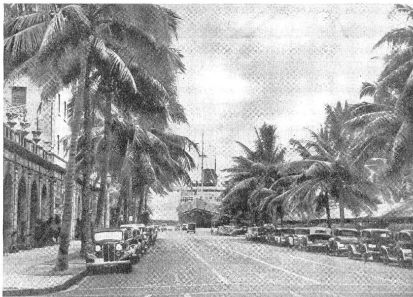
Hauptstraße von Honolulu auf Hawai mit Hafen im Hintergrund. — Route principale de Honolulu à Hawai. A l'arrière-plan: le port. — Strada principale di Honolulu nell'isola di Hawai col porto sullo sfondo.

Hawai wurde 1527, also vor Japan, von den Spaniern entdeckt. 1778 hißte hier der Seefahrer Cook, der die Sandwichinseln zu Ehren seines Gönners Lord Sandwich so nannte, die Union Yack, ohne daß den Eingeborenen ihre politische Souveränität genommen wurde. Der Einfluß der USA machte sich erst seit der Mitte des vorigen Jahrhunderts geltend. Da die auf Hawai niedergelassenen Plantagenbesitzer ein großes Interesse an zollfreier Einfuhr von Zucker in die