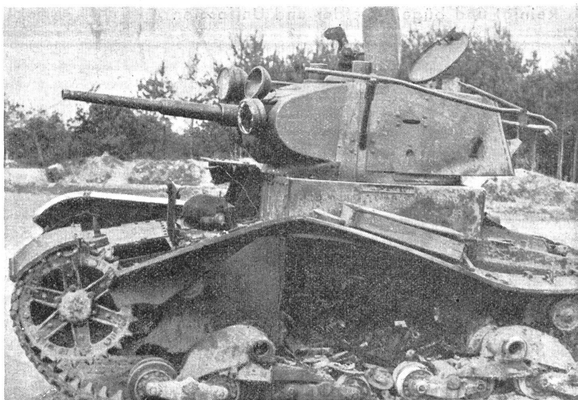
So wirkt die Panzerabwehr! — Ainsi agit la défense antichars! — Gli effetti della difesa anticarro!

Damit habe ich Dir, lieber Kamerad von der Infanterie, einen kleinen Ueberblick gegeben über unsern Dienst und unsere Arbeitsweise. Wenn