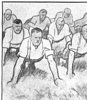
Aber auf's Morgenturnen freut sich die ganze Kompanie; bei dem guten Kommando klappt es ausgezeichnet.