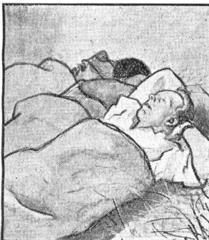
Das Aufstehen früh um 5 Uhr wird den älteren Soldaten nicht ganz leicht, die Glieder sind noch steif vom Pickeln und Schaufeln.

mentlich wertvoll aus im unbekannten Ruf-land. Die dortigen kriegerischen Ereignisse können an Hand dieser ebenso billigen Karte bis in die Einzelphasen verfolgt werden. Sie wird aber auch für die Verfolgung kommender kriegerischer Auseinandersetzungen gute Dienste leisten, da Kaukasusgebiet und die Gegenden am Schwarzen und am Kaspischen Meer eingehend dargestellt sind.