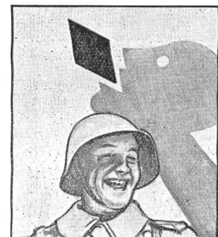
Er lässt sich halt immer Gaba von daheim schicken, denn er weiss: Gaba hält die Stimme klar.