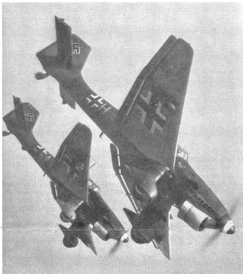
Bild 7. Deutsche Sturzkampfflugzeuge Ju 87 beim Ansetzen zum Sturzflug.

Infolge seiner geringen Ausmaße bildet er für die Bodenabwehr ein schwer zu treffendes Ziel. Gezielt wird mittels des ganzen Flugzeuges in Richtung der Längsachse. Neben ihrer normalen Fallgeschwindigkeit erhält die Bombe noch eine beträchtliche Beschleunigung, die die Treffsicherheit erheblich steigert. Hauptanforderungen an Stukas sind neben großen Festigkeiten auch große Geschwindigkeit und Wendigkeit. Es sind meistens einmotorige Maschinen, mit ein bis zwei Mann Besatzung. Die Bewaffnung besteht aus einem bis zwei starren Maschinengewehren für den Flugzeugführer und bei Zweisitzern aus einem beweglichen MG für den Beobachter. Es vermag