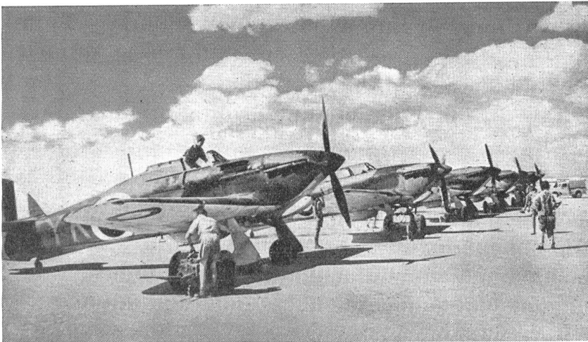
Bild 9. Englische Hurricanes-Jagdstaffel in Nordafrika.

nen, der aber gleichzeitig für den Luftkampf und den Eingriff in den Erdkampf geeignet ist. Daß eine solche weitgehende Vielseitigkeit auf Kosten der allgemeinen Leistungen gehen muß, ist leicht einzusehen. Während alle andern Luftmächte diesen Typ aufgaben, hatte die französische Luftwaffe ihn noch lange beibehalten. Es waren durchweg zweimotorige Flugzeuge mit einer Reichweite von 1000—2000 km und einer Bombenlast von 1000 bis 1200 kg. Heute ist an seine Stelle der schwere Bomber getreten, der größere Lasten in weitere Entfernungen zu befördern vermag.