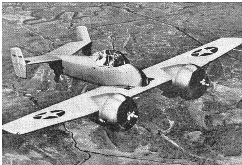
Bild 12. Amerikanisches Zerstörer-Flugzeug Skyrocket.

Ein einsitziges Zerstörerflugzeug ist der amerikanische Typ Grumman F5F1 «Skyrocket». (Siehe Bild 12.) Es soll eine Maximalgeschwindigkeit von 700 km/h erreichen, besitzt zwei Motoren zu je 1200 PS. Die Bewaffnung besteht aus zwei oder vier Flugzeugkanonen zu 37 mm oder 20 mm und zwei Maschinengewehren.