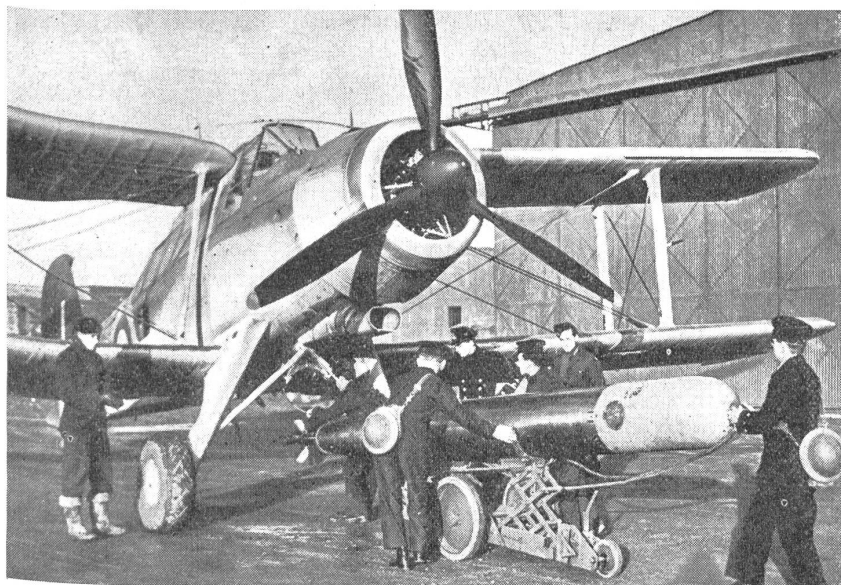
Bild 8. Englischs Torpedoflugzeug Typ Albacores.

In den modernen Luftwaffen werden sie nicht mehr verwendet, denn sie sind veraltet und nicht mehr zweckentsprechend. Man kann den Kampfmehrsitzer zu den schweren Bombern rech-