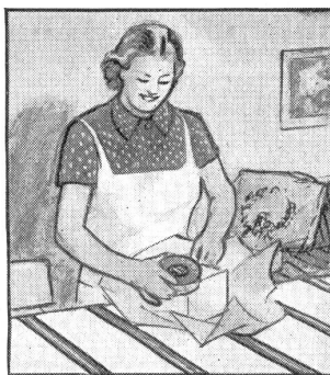
„Von jedem etwas. Und dazu eine grosse Schachtel Gaba, die ist sowieso recht.“