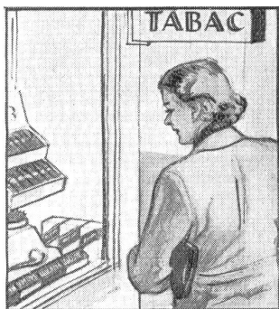
Gleich am nächsten Sonntag soll er ein Päckli haben. „Wenn ich nur wüsste, was er mag: Cigaretten, Stumpen oder Tabak?“