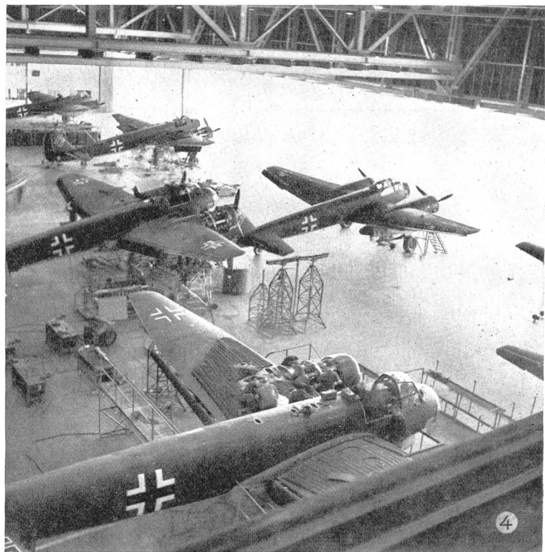
Eine Serie der bekannten Zerstörer und Leichtbomber Junkers 88 verläßt die Halle, um eingeflogen zu werden. Bei den Abnahmeprüfungen sind ganz bestimmte Flugleistungen zu erfüllen. Nach der letzten — der sogenannten Fertigkontrolle — gelangen die Maschinen zum Einsatz, um die Ausfälle und den Abgang, sowie reparaturfähige Maschinen zu ersetzen.

Nicht nur bei Materialtransporten, sondern auch bei Umgruppierungen innerhalb der kämpfenden Truppe konnten die Ju 52 und Ju 90 ihr großes Fassungsvermögen und ihre unübertroffene Sicherheit unter Beweis stellen. In einem Falle wurde mit Ju-