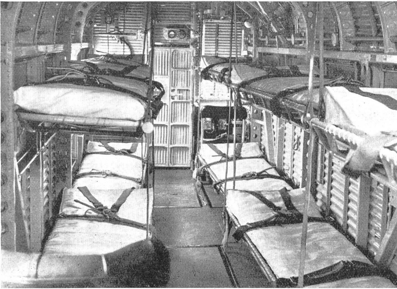
Im Raum eines Seerofflugzeuges. Ueber den Feldbetten sind sowohl Schulter-, Bauch- und Beingurten angebracht, um die Verwundeten vor dem Herunterfallen zu schützen. Arzt und Krankenpersonal ist neben den Flugzeugbesatzungen den Sanitätsflugzeugen beigegeben.

führt worden. Erst als nach dem Weltkrieg verschiedene Staaten in Kolonialkriege verwickelt wurden, ging man ernstlich an den Ausbau eines reinen Sanitätsflugdienstes. Aber es blieb auch hier beim umgebauten Kriegsflugzeug. Deutschland, dem der Bau von Kampfflugzeugen untersagt war, und das deshalb zwangsläufig im Bau von Verkehrsflugzeugen an die erste Stelle rückte, blieb es vorbehalten, den Weg vom Verkehrsflugzeug zum Sanitätsflugzeug zu gehen. Eine kurze Uebersetzung zeigt schon, daß die Anforderungen an beide Typen, abgesehen von der leicht auswechselbaren Inneneinrichtung, fast völlig gleich sind.