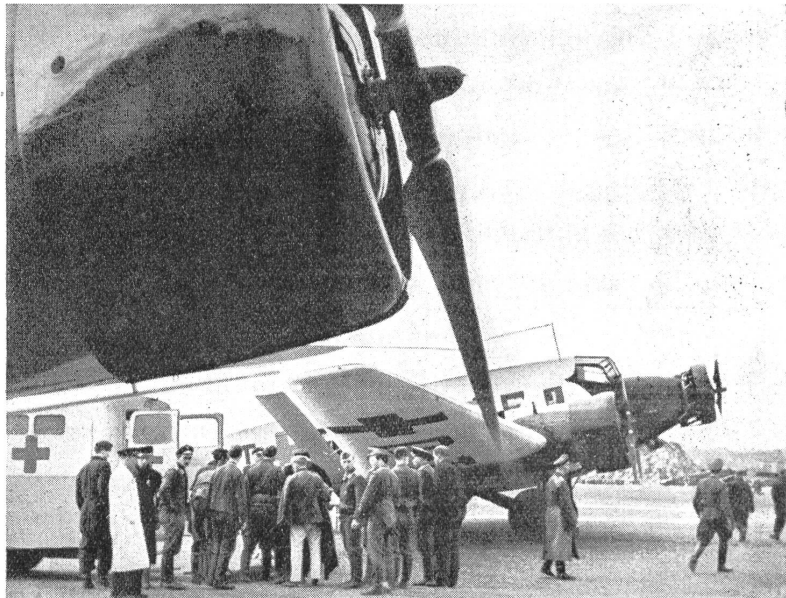
Ein Sanitätsflugzeug Ju 52 ist gelandet. Die Verwundeten werden sofort mit einem Sanitätsauto in das nächstliegende Lazarett befördert.

F 13, G 24, G 31 und Ju 34 hervorragend für den Sanitätsdienst, so war es fast selbstverständlich, daß auch die berühmteste Vertreterin dieser von Junkers geschaffenen Flugzeugreihe, die auf allen Kontinenten vertretene Ju 52, die man als das sicherste Verkehrsflugzeug der Welt bezeichnet, ein ideales Beförderungsmittel für Verwundete und Kranke abgeben würde. Im Gran-Chaco-Krieg, im spanischen Bürgerkrieg, in zahlreichen Manövern und neuerdings im Feldzug gegen Polen und in den heutigen Kämpfen hat dieses Flugzeug seine hervorragende Eignung für diese Sonderverwendung erwiesen. In Fällen, in denen die Transporte der Schwerverwundeten über die schlechten und zerschossenen Straßen Polens im Kraftwagen tagelang gedauert hätten, wurden die Verwundeten hinter die Front bis zum nächsten Flugplatz befördert, wo ein modern eingerichtetes Ju-52-Flugzeug auf sie wartete. Die Seitenwände des Rumpfes brauchten nur aufgeklappt zu werden, worauf die Sanitäter die Bahren mit den Verwundeten sorgfältig in das Innere des Flugzeuges heben konnten. Acht Schwerverwundete oder 22 Leichtverwundete, die den Flug sitzend zurücklegen können, nimmt die Maschine auf. Auf schnellstem Wege gelangten sie so in die Heimatlazarette, wo jede erdenkliche sanitäre und ärztliche Fürsorge sie erwartete. Wenn man bedenkt, daß es auf diese Weise möglich geworden ist, Verwundete, die am Morgen tief in Polen verwundet wurden, noch am Nachmittag des gleichen Tages in einem neuzeitlichen