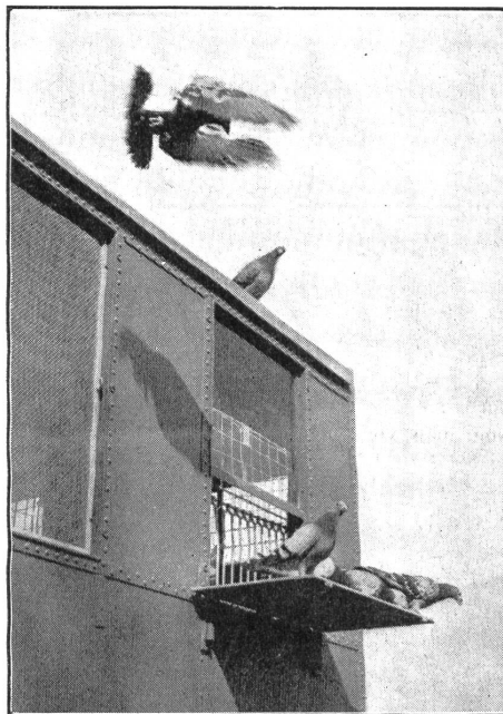
Piccione in arrivo ad una colombaia mobile. Vedasi la tecnica del volo (No. cens. N/V 2142a).

Il suo «appartamento» può essere installato nei solai delle case in posizione piuttosto solitaria. Condizione principale però, è che le pareti ed i tetti offrano abbastanza protezione contro il freddo e l'umidità. Le dimensioni dello spazio devono accomodarsi al numero dei