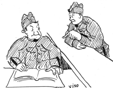
Anmeldung im Komp.-Büro

Der „Zivilischi“: Isch bi Eu villicht na e Strohburdli frei?