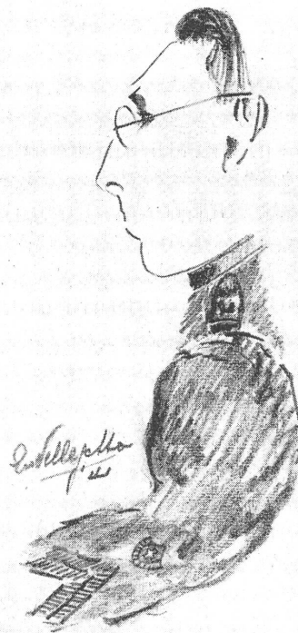
CARICATURE DI PELLEGATTA.

IL SOLDATO MAGRO: Sig. Maggiore, lui era anche il nostro «spazabidun»... (Vignetta del fuc. Pepi.)