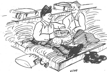
Tante Amalie häi' ja guet gmeint; aber sie isch halt churzichtig!