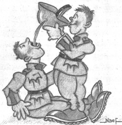
En „Hölle-Durst“! Zeichnung von Fw. E. Naef