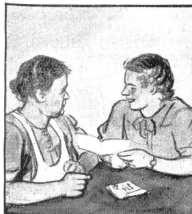
„Warum sind Sie denn so ängstlich, der Bub schreibt doch ganz vernünftig von der Grenze. Er bittet halt um Zigaretten, wie alle.“