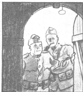
's wär schon recht, das Kantonement, Platz genug und frisches Stroh, — aber zügig ist es.

Junge, der ständig Heimweh hat und oft heimlich die Tränen abwischt. Ich kann mir dieses Gefühl gar nicht vorstellen. Weshalb zieht denn einer aus, wenn er das Fortsein nicht erträgt? Ich bliebe unter allen Umständen dort, wo mich etwas bindet. Aber der Mensch ist ein gar komisches Wesen, das meistens sich selbst am wenigsten kennt. Daß die Legion kein Ferienheim ist, hat jeder von uns wissen müssen, trotz den Lügen der Werber, die einem alles recht rosig darzustellen wissen. Daß dem nicht so ist, das wußte ich. Aber ich wollte nach Afrika. Allerdings die Ueberfahrt habe ich mir anders vorgestellt. Ich dachte mich an Deck im Silbermondschein, der über dem unendlich scheinenden Meere lagert... Statt dessen sitze ich in diesem elenden Raum mit vielen andern, die sich faule Witze erzählen, Würfel spielen oder, von der Seekrankheit erfaßt, ihren Magen entleeren, so daß die Nase kein empfindlich Ding sein darf, wenn sie sich nicht beleidigt fühlen soll. Aber man darf schon etwas auf sich nehmen, wenn man nach Afrika fährt... (Fortsetzung folgt.)