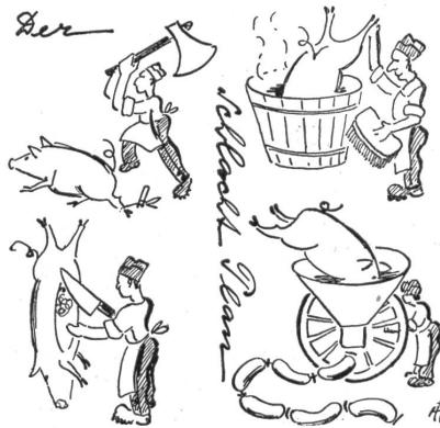
Militärische Begriffe aus der Zivilisten-Perspektive

Paradox ist es, daß sich zwei mit Steinen bewerfen, um den Frieden im Hause herzustellen! (Die gäbet sich doch besser und billiger grad ... d'Hand!) Gin.