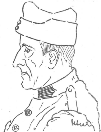
...e l'app. (fresco fresco) A. Zanetti, visti dall'app. Francesco Alberti.