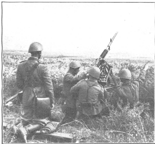
Leichtes griechisches Flabgeschütz im Vorgelände von Saloniki.

Pièce légère de DCA grecque en position aux environs de Salonique.