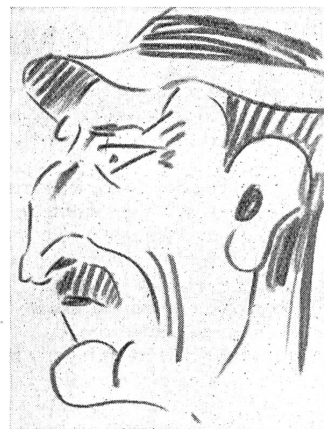
Due complementari: un operaio...