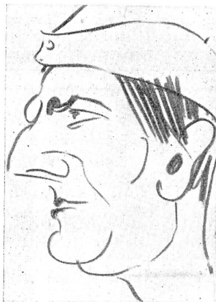
... e uno dei servizi amministrativi, ritratti dal s. c. Beretta-Piccoli Carlo.