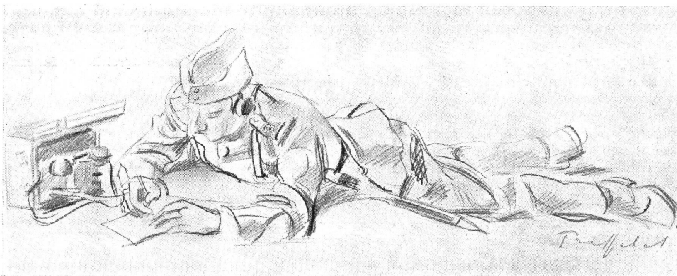
Zeichnung von F. Traffelet, Bern.