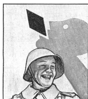
Er lässt sich halt immer Gaba von daheim schicken, denn er weiss: Gaba hält die Stimme klar.