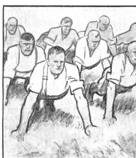
Aber auf's Morgenturnen freut sich die ganze Kompagnie; bei dem guten Kommando klappt es ausgezeichnet.