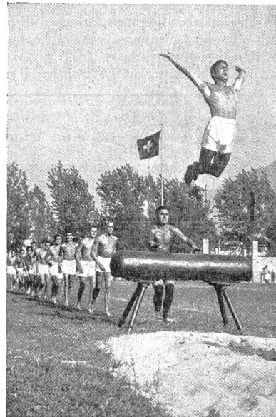
VI Br 5081

Il centro atletico di Ascona, forgiando dei magnifici campioni di soldati-atleti, ha valso a far potenziare anche fra la popolazione civile l'amore e l'ammirazione verso i nostri soldati, verso il nostro brillante esercito.»