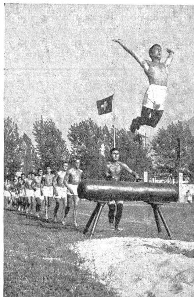
VI Br 5081

Il centro atletico di Ascona, forgiando dei magnifici campioni di soldati-atleti, ha valso a far potenziare anche fra la popolazione civile l'amore e l'ammirazione verso i nostri soldati, verso il nostro brillante esercito.»