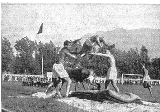
VI Br 5080 Salto mortale sul cavallo allungato

«La manifestazione militare-sportiva di Locarno, non ha fatto che ripetere, forse anche ingigantire il successo della giornata sportivo-militare di un mese fa a Lugano. Successo di folla, entusiasmo a josa, organizzazione perfetta, soddisfazione da parte dei nostri Ufficiali superiori, una partita molto interessante di calcio, una dimostrazione perfetta ed indimenticabile da parte dei soldati-atleti. Una giornata magnifica, veramente di sport in grigio-verde.»