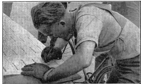
VI H 4914

die Konkurrenz im Radfahren mit Einzelstart über eine reine Straßenstrecke von 32 km mit rund 300 m Höhendifferenz in den Tälern der Limmat, der Reppisch und am Mutschellenpaß. Den Ausgleich zu den vier sportlichen Konkurrenzen bildete das militärische Schießen auf zehn, je 6 Sekunden sichtbare Feldscheiben, Distanz 200 m, wobei drei Schützen das Maximalresultat von zehn Treffern erzielten. Anschließend an das Hauptverlesen fand die Rangverkündigung statt, und von einem reichen Gabentisch, den Gönner und Angehörige der Kompanie inzwischen gebildet hatten, konnten den Besten im Gesamtklassement und in den einzelnen Disziplinen schöne Ehrenpreise von teilweise bleibendem Wert verabfolgt werden. Jeder Teilnehmer erhielt außerdem eine künstlerische Urkunde als Leistungsausweis und bleibende Erinnerung.