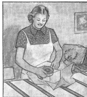
„Von jedem etwas. Und dazu eine grosse Schachtel Gaba, die ist sowieso recht.“