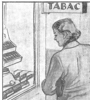
Gleich am nächsten Sonntag soll er ein Päckli haben. „Wenn ich nur wüsste, was er mag: Cigaretten, Stumpen oder Tabak?“