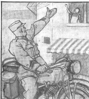
Die beiden kennen sich noch nicht lang — aber es hat doch einen ausführlchen Abschied gegeben, als er einrückte.