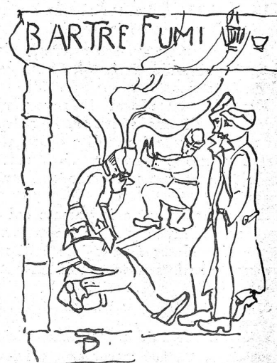
Il rinomato «Bar Tre Fumi». (Disegni del Fuc. D. Saporiti.)

Qualche volta si esce, è vero, in escandescenze: se il vento è troppo gelido, se un sasso è troppo duro da spaccare... ma poi si impara una cosa: che il miglior modo di difendersi dagli impulsi è di scoppiare in una bella grossa risata. Cosa che facciamo spesso. Con ciò ti saluto.