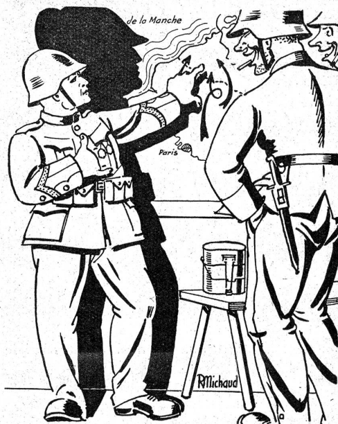
Au corps de garde