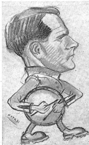
Sanitario Clelio Tamburini: ul scmanegiun (Disegno del Fuc. Renato Notari)