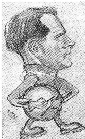
Sanitario Clelio Tamburini: ul scmanegiun (Disegno del Fuc. Renato Notari)