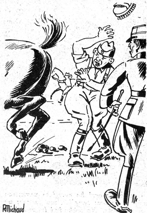
Un fichu dragon.

Le lieutenant: Vous n'avez donc jamais soigné de chevaux, à la maison?