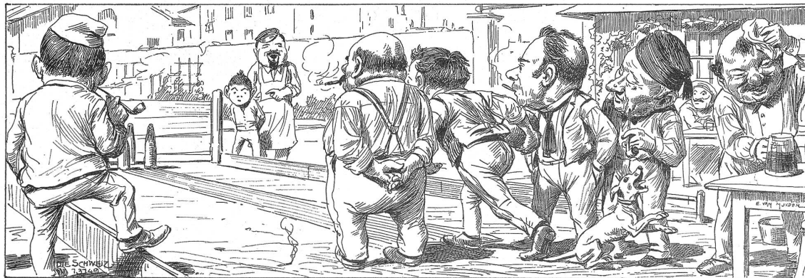
Humor von Anno dazumal