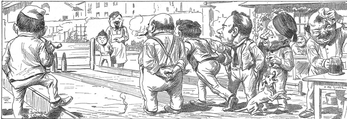
Humor von Anno dazumal

Unser Zug baut seit langem an einem Bunker auf bewaldeter Höhe. Kürzlich kam ein hoher Stab zur Besichtigung. Drunten im Loch konnten wir hören, wie der Herr Divisionär zum Genteiloffizier sagte: «Die Leute kommen offenbar nicht sehr vorwärts mit dieser Waldstellung!» Da höre ich meinen Nebenmann brummen: «De chunnt mer jetz au no fründlich! Eus isch emol 's Efeu nonig rund ums Chäppi eine gwachse und a d'Chragepatte!», wobei er mit dem Daumen bedeutungsvoll «obsi» deutete. Motrdf. AbisZ.