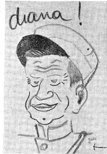
Il nostro Sergente Maggiore

Chi zufola, grida entrando... «Diana» chi senza riguardo ci sveglia a «mañana»