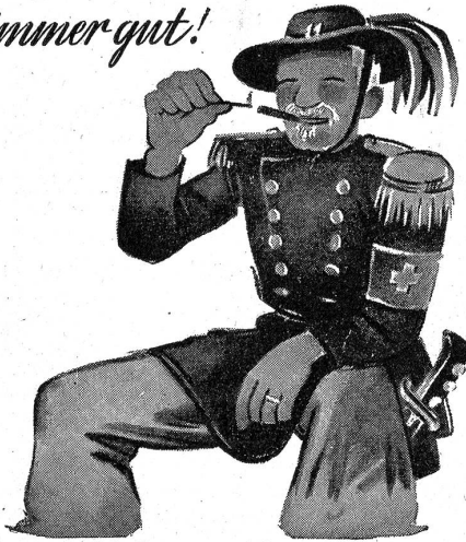
Päckli zu 10 Stück und Schächteli 2 x 5

O.CAMINADA ZÜRICH4 vis à vis Kaserne SPEZIALGESCHÄFT FÜR SÄMTLICHE MILITÄR-BEDARFSARTIKEL