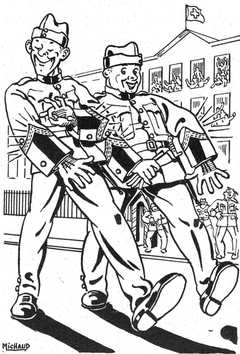
Première sortie après l'école de sous-off.