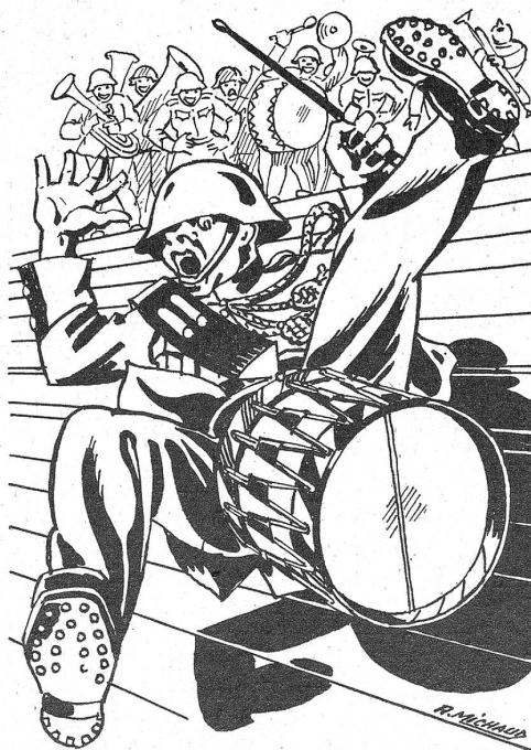
Nouvelle version de „Roulez tambours ...“