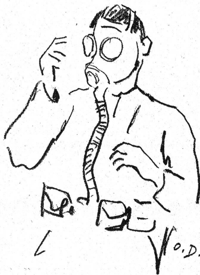
LA MASCHERA: Disegno del fuc. O. Dickmann, Ascona.

Il fugin sta bene. Ti dico però che diventando grande diventa un poco prepotente. Dice sempre no ancora prima che io gli dico di fare una cosa. Quando casca e si fa male e gli dico: Ti sei fatto male? Dice: Nooo! E guai se si insiste. Se gli dico: Andiamo a letto che è l'ora; dice: Nooo! E bisogna portarlo di peso. Se gli dico: Mettiti il piccolo paltò