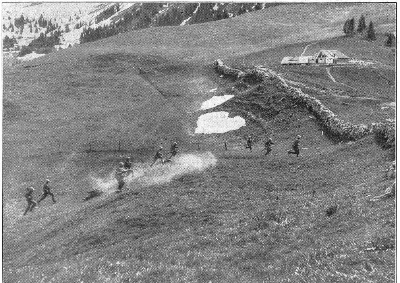
Infanterie greift an. Die letzte Phase des Angriffes, der Sturm auf die feindliche Stellung. L'infanterie à l'attaque. Dernière phase d'une attaque: l'assaut de la position ennemie. La fanteria all'attacco. L'ultima fase: L'assalto alla posizione nemica.