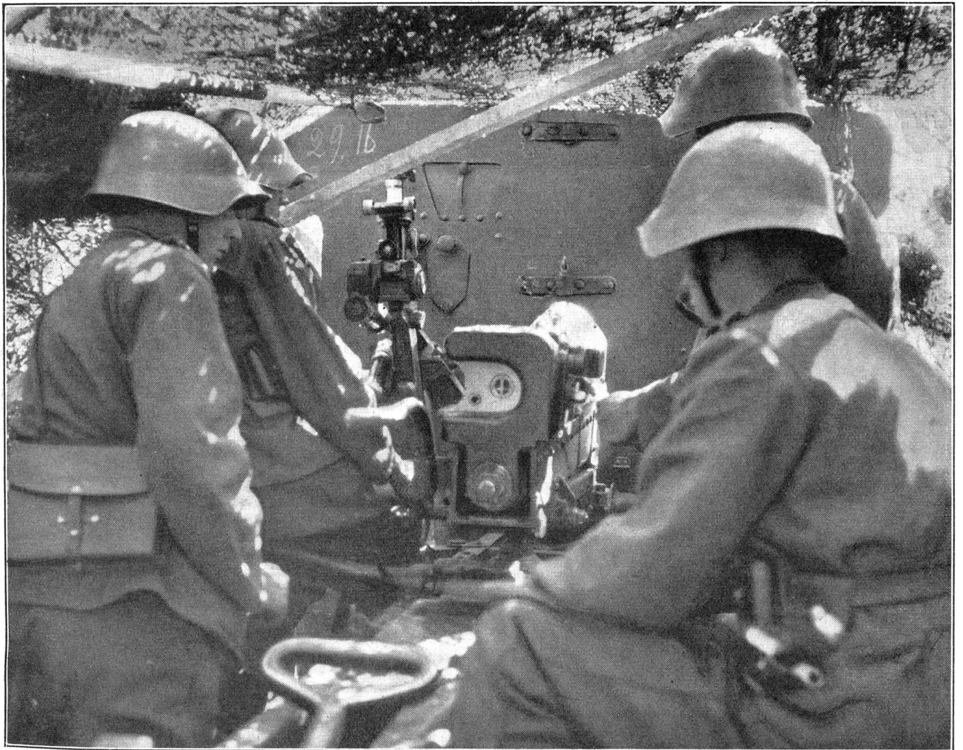
Vom Tarnen. Gefarntes 7,5-cm-Feldgeschütz. (Siehe auch Bild Nr. 6 und 7, Seite 43.)