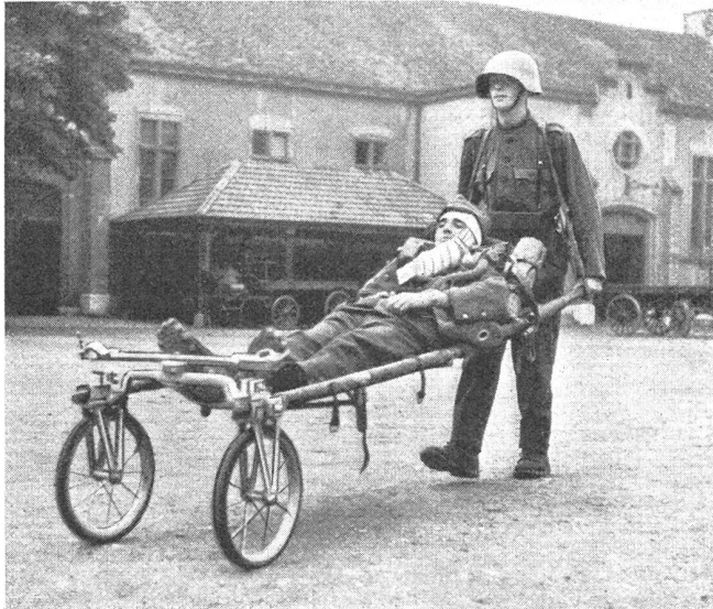
Die Räderbahre, System Isler, bei der Verwendung im Verwundeten-Einzeltransport.

Der große Prozeß gegen die kommunistische Werbezentrale für Spanienfahrer wird vor dem Divisionsgericht 5a in Zürich gegen Ende dieses Monats durchgeführt. Die Strafanträge werden aufrechterhalten gegen 10 Personen, unter denen sich führende Häupter der kommunistischen Partei befinden.