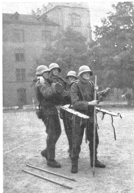
Für den Transport im Gebirge kommt das Sanitäts-Verwundetenrät für sitzend zu transportierende Verwundete in Anwendung.

England plant neue Maßnahmen zur Mechanisierung der Armee. Die Maschinengewehre sollen stark vermehrt und neue, schnelle Tanks sollen eingeführt werden. Die Artillerie wird weitgehend motorisiert. ★