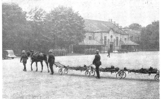
... durch Verwendung mehrerer Radgestelle und Weber-Bahren auch für den mehrfachen Verwundeten-transport mit Pferdezug verwendet werden.

La barella sistema Isler può essere usata, mediante apposita combinazione, anche per il trasporto simultaneo di due feriti. (Vedi fig. 6).