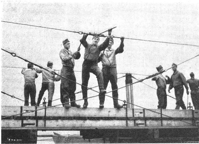
Eine der letzten Arbeiten beim Bau einer Schiffsbrücke ist das gleichzeitige Anziehen der Drahtseilgeländer durch die Pontoniere.

Un des derniers travaux de la construction d'un pont de bateaux est la tension du câble garde-corps par les pontonniers.