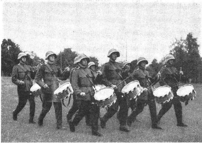
Marschübung der Tambouren auf dem Exerzierplatz. Marche d'exercice de tambours sur la place d'exercice. Esercizio di marcia sulla piazza d'armi.