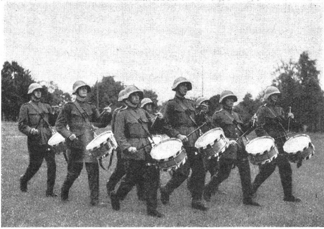
Marschübung der Tambouren auf dem Exerzierplatz. Marche d'exercice de tambours sur la place d'exercice. Esercizio di marcia sulla piazza d'armi.

der Infanteriebrigade 13 übertragen; damit tat von Muralt den entscheidenden Schritt zum künftigen hohen Truppenführer. Im Sommer 1932 wurde er als Nachfolger von Oberstdivisionär Lardelli, der zur 6. Division überwechselte, zum Kommandanten der 5. Division ernannt, die er während 5½ Jahren bis zu ihrer Auflösung in pflichtbewußter Arbeit erfolgreich geführt hat.