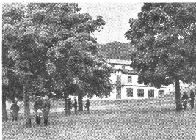
Tambour-Rekruten beim Ueben unter Bäumen verteilt, je ein schwacher und ein guter Tambour zusammen.

werden anfangs auf kurze Distanzen beschränkt, um später weiter ausgedehnt zu werden. Bis zur Zeit der Verlegung müssen alle Tambouren soweit ausgebildet sein, daß jeder einzelne imstande ist, vor einer Kp. zu schlagen, wobei der Tambour das Tempo und die Schrittlänge genau einzuhalten hat. Sichere Kenntnis der Märsche 1—12 und eine präzise Schlagweise in technischer, ganz besonders aber in rhythmischer Hinsicht, sind für den Militärtambour unerlässlich, soll er auf dem Marsch ein nützlicher Helfer sein. Die Schrittlänge von 80 cm ist für den Militärtambour Vorschrift. Man bezweckt damit, unter Berücksichtigung der Infanteristen im Feldmarsch (nicht im Gebirge) eine bestimmte Marschleistung zu erreichen und zu fördern. Während des Ausmarsches werden die Tambouren auf die Kpn. verteilt und ihre Aufgabe ist es nun, zu zeigen, was sie inzwischen gelernt haben. Damit ist aber ihre Ausbildung bei weitem nicht abgeschlossen. In der Verlegung werden alle Tambouren wieder zusammen genommen und