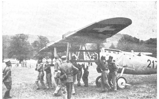
Der vollständig vom Rumpf gelöste Flügel wird abgehoben.

Die Vorliebe von uns Frauen für das « Zweierlei Tuch », unsere Begeisterung und Rührung beim Anblick der stramm vorbeimarschierenden Soldaten ist keine sinnlose Schwärmerei. Sie hat ihren guten Grund, denn mehr oder weniger bewußt fühlen wir: das sind unsere Beschützer, unsere Verteidiger und Retter, wenn feindliche Horden in unser Land eindringen, unser