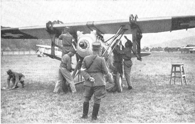
Flügelscheren montiert. Lösen der Flügelschlüsse und Spannkabel vom Rumpf.

Les supports d'aile sont montés. Desserrage des points d'attaches de l'aile et câbles diagonales du fuselage.