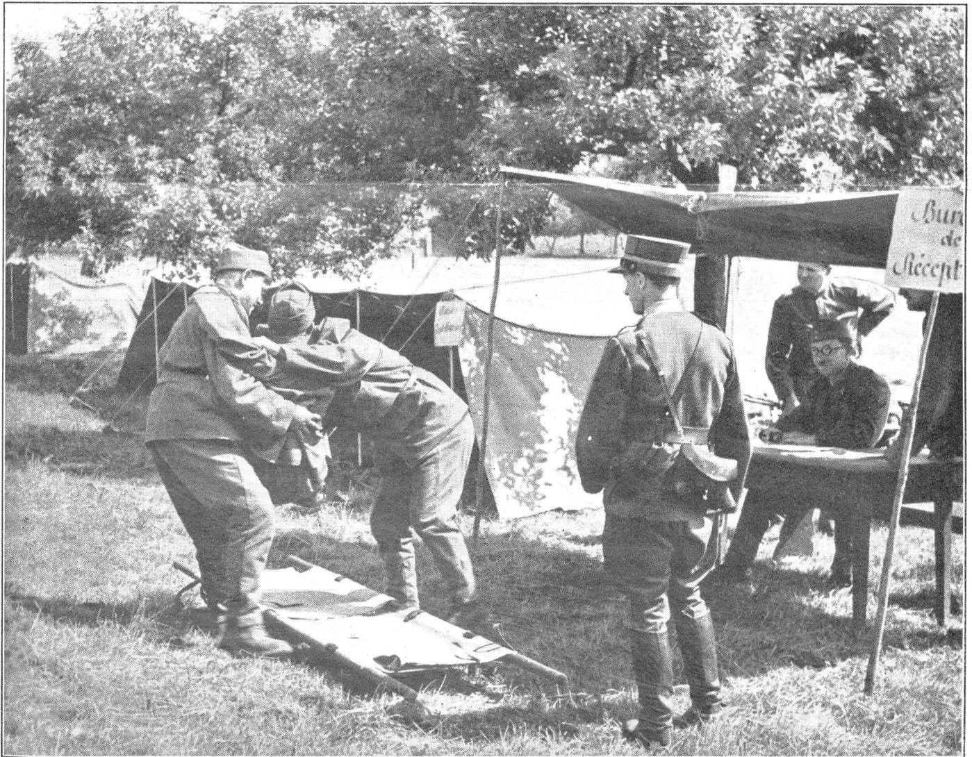
Unsere Sanität. Einlieferung eines Verwundeten in eine feldmäßig eingerichtete Ambulanz. Notre service de santé. Arrivée d'un blessé dans une ambulance de campagne. La nostra sanità. Consegna di un ferito ad un'ambulanza di campagna.