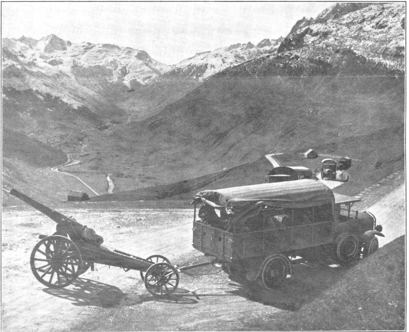
Die Waffen unserer Artillerie. Schwere Motorkanonen-Batterie auf der Fahrt auf einer Pafßstraße. Les armes de notre artillerie. Batterie motorisée de canons lourds en mouvement dans un col alpestre. Le armi della nostra artiglieria. Batteria pesante motorizzata su di una strada alpina.