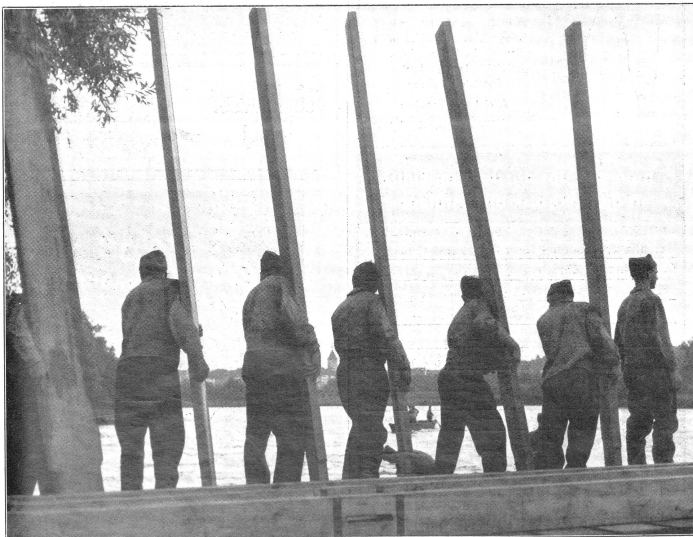
Bau einer Schiffbrücke durch unsere Pontoniere. Der Lädentrupp steht bereit, die starken Brückenladen auf die ausgelegten Streckbalken zu verlegen. Construction d'un pont de bateaux par nos pontonniers. La troupe des madriers est prête à placer les gros madriers sur les poutrelles. I nostri pontonieri alla costruzione di un ponte su barche. Il gruppo designato pronto alla posa di solidi assi sulle traverse del ponte.