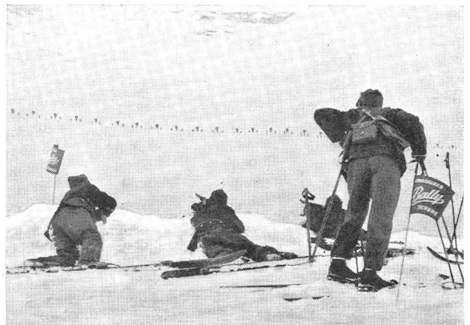
Militär-Skipatrouillenlauf. Auf dem Schießplatz der Militär-Skipatrouillen der Schweren Kategorie auf Eigergletscher.

Leider besteht die Gefahr eines Weltbrandes immer noch, wenn sich auch von Zeit zu Zeit vorübergehende Aufhellungen am politischen Horizonte zeigen. Erst wenn einst die in den verschiedenen Ländern für die Aufrüstungen bereitgestellten Milliarden verausgabt