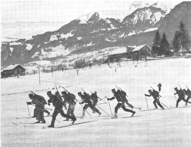
Militär-Staffettenlauf. Gemeinsamer Start der ersten Staffettenläufer im Talboden von Grindelwald.

Course de relais militaire. Start du 1 er équipier de l'estafette dans le Talboden de Grindelwald.