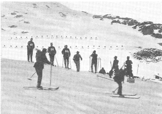
Militär-Skipatrouillenlauf. Die Patrouillen der leichten Kategorie absolvierten ihr Schießpensum auf der Kleinen Scheidegg. Jeder Gewehrtragende einer Patrouille hatte ein durch einen Ziegel markiertes Ziel auf eine Distanz bis zu 120 Meter niederzukämpfen, wozu ihm maximal 6 Schüsse zur Verfügung standen.

Bald hier, bald dort, allerdings nur noch leise, leise, erhoben sich Stimmen in unserm Lande, die verwundert fragen, ob «man» nicht daran denke, mit «Aufrüsten» einzuhalten und das dadurch ersparte Geld der «Wehranleihe» für andere Zwecke zu verwenden. Die Kriegs-