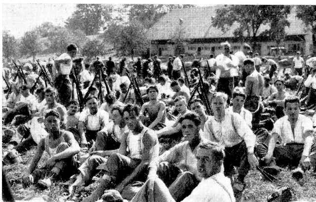
Soldatische Erholungsstunden: Nach anstrengendem Marsch bringt ein längerer Halt die nötige Erfrischung.

Après une marche pénible, une longue halte redonne aux soldats vigueur et bonne humeur.