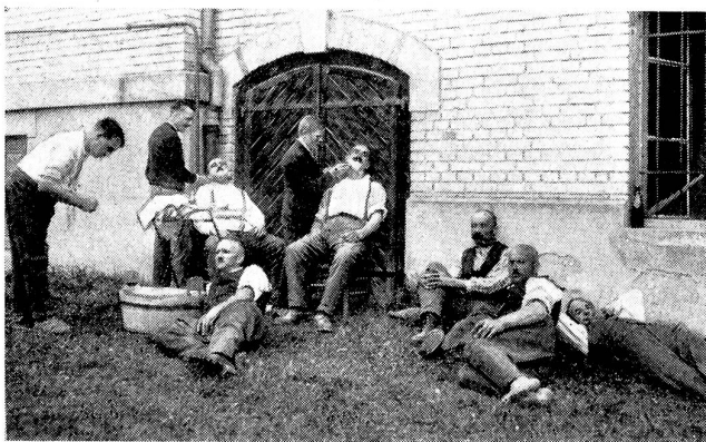
Landwehr im «Salon des Hofcoiffeurs».

La landwehr au salon du «Coiffeur de la Cour»!