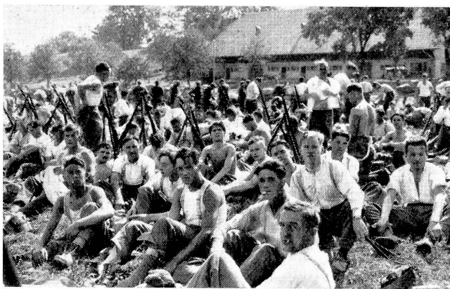
Soldatische Erholungsstunden: Nach anstrengendem Marsch bringt ein längerer Halt die nötige Erfrischung.

Après une marche pénible, une longue halte redonne aux soldats vigueur et bonne humeur.