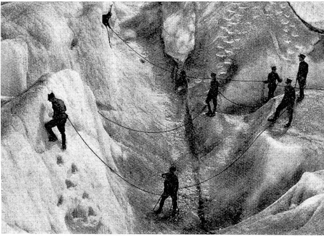
Eine Klasse des Zentralkurses für Gebirgsausbildung beim Unterricht über Stufenschlagen auf dem Rhonegletscher.

Ici, sur le glacier du Rhône, une classe du cours central pour l'instruction alpine est instruite sur l'art de tailler des marches dans la glace.