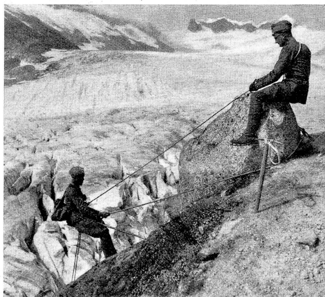
Abseilen im Fels: Für die Sicherung mittels eines zweiten Seiles beim Abseilen im Fels wird zweckmäßigerweise die Schultersicherung angewendet, bei welcher das Seil unter der Achsel des Sichernden durch über dessen Rücken und die gegenüberliegende Schulter nach vorne zur Hand gleitet, welche das in Schlingen vor dem Sichernden liegende Seil ausgibt.

Rappel de corde dans le rocher: pour assurer la descente le long du rocher au moyen d'une seconde corde, on assure généralement aux épaules. La corde est passée sous l'aisselle, puis, par le dos, elle monte sur l'autre épaule et passe enfin dans la main qui la tient en anneaux et la laisse glisser au fur et à mesure de la descente.