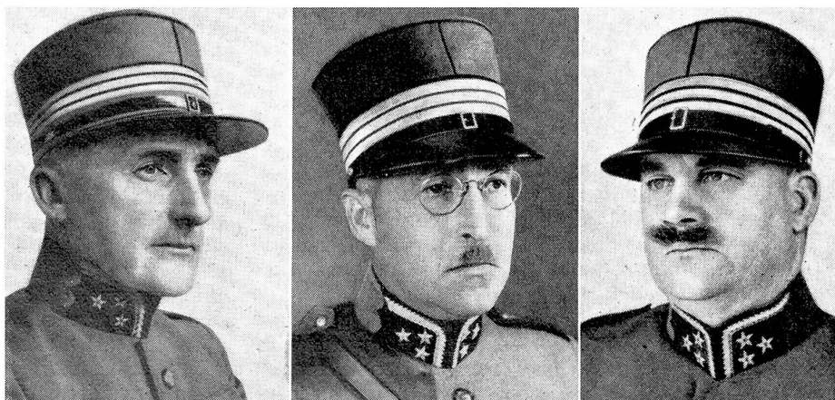
Die neuen Kommandanten der selbstständigen Gebirgsbrigaden. - Von links nach rechts:

Le nombre considérable de concours disputés pendant ces quatre journées nous interdit d'en parler ici bien longuement, étant donné que la place nous est comptée avec une parcimonie contre laquelle nos lecteurs suisses-romands se sont déjà élevés à diverses reprises avec vigueur. Un très nombreux public les suivit avec beaucoup d'intérêt, et sous ce rapport, le concours d'obstacles qui est certainement le plus spectaculaire, remporta un très légitime succès lorsqu'après une première journée de pluie torrentielle, le soleil voulut bien se mettre de la partie et sécher les divers emplacements de concours. Les exercices de conduite du groupe de fusiliers et de mitrailleurs au combat furent sans doute parmi les plus intéressants, malheureusement le terrain approprié qu'ils exigent ne permet que rarement de les exécuter aux places visitées par le public et c'est grand dommage, car ils représentent l'une des disciplines les plus importantes de l'ASSO et l'une des activités les plus profitables à l'armée. Plus de 70 groupes, dont les \frac{2}{3} de